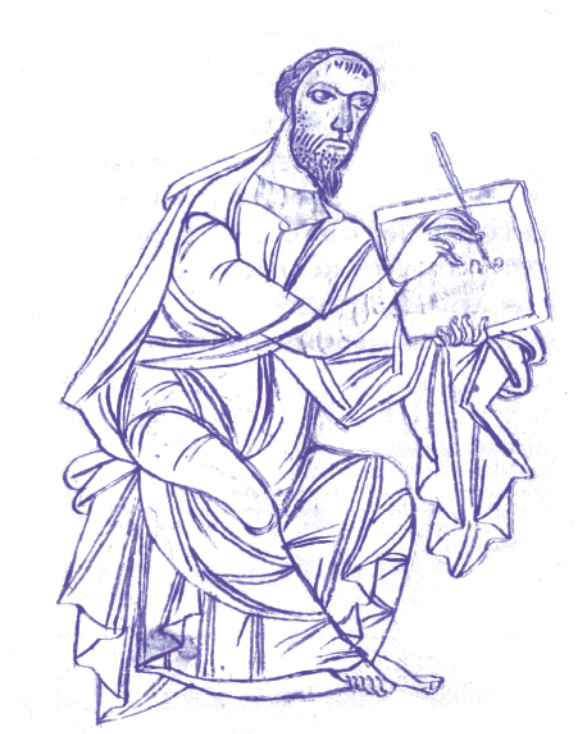
Der schreibende Paulus in einer frühmittelalterlichen Ausgabe seiner Briefe